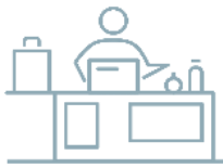
Fler framgångsrika företag

Våra tre verksamhetsmål är framgångsfaktorer för en stark och uthållig näringslivsutveckling i Göteborgsregionen. De tar avstamp i politiska styrmedel, regionala direktiv, bolagets styrdokument och förutsättningarna i vår omvärld. De tre målen är tätt kopplade till varandra och i många delar avhängiga av varandra.